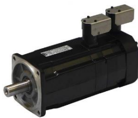
Image 2. Gas servo motors.

Silownik gazowy n'est pas correctement traduit en anglais. Le dictionnaire propose un équivalent incorrect : gas servomotors . Tandis qu'il y a deux équivalents corrects : gas spring ou gas lift . Cette mauvaise traduction consiste à la divergence conceptuelle entre gas servo motors et gas spring .