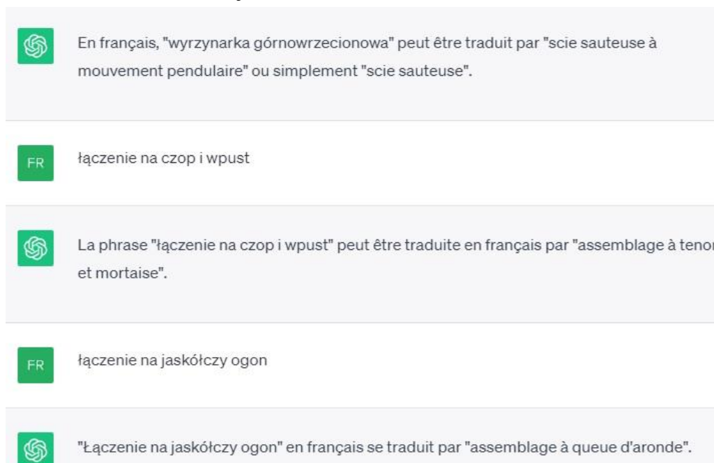
Image 4. Les exemples de la traduction des termes spécialisés choisis, d'après le GPT chat.